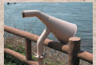
礪浜聴音器 「福良の浜」近くにあるこのメガホンのようなもの。耳をあててみてください。驚くほど波の音が良く聞こえます。