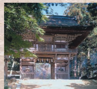
三國神社 大山昨命(くいのみこと)と継体天皇をお祀りした神社。県指定文化財の太刀と立願文のほか、実物大の木造彩色の神馬が安置されています。5月の三國祭では、毎年この三國神社へ山車が奉納されています。