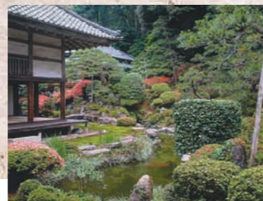
瀧谷寺 永和元年(1375年)に創建された三國町最古の寺院。文化財である鎮守堂、開山堂などの貴重な建造物が多く、国指定名勝庭園の指定を受けた山水庭園は、いつまで見ても飽きない美しさです。