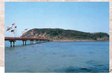
雄島 周囲約2キロと越前海岸でもっとも大きな島。地元では昔から「神の島」と崇められています。朱塗りの大橋をわたり石段を登ると、歴史の古い神聖な大湊神社をはじめ島の中は神秘的な雰囲気。約1.5キロある遊歩道では太古から生い茂る大木や海食による崖なども楽しめます。清水の湧く「瓜割の水」もぜひどうぞ。