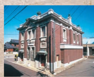
旧森田銀行 北前船による廻船業で栄えた、豪商森田家が創業した森田銀行。1920年に落成された建物で、外観は西欧の古典主義的なデザイン。窓の巻上式シャッターや、内部の豪華な漆喰装飾は圧巻です。