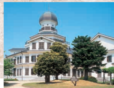
みくに龍翔館 明治12年に建てられた「龍翔小学校」を模して造られたもので、館内は北前船の5分の1の模型、高さ11mの三國祭の山車などを展示。360度パノラマの展望台からは三國沖の美しい日本海や、古い町並みを見下ろせます。