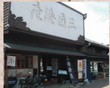
三國湊座 三國湊町中散策やレンタサイクルなど町中のツーリストセンター。甘味処や食堂としての休憩所でもあり、三國パーカーはここで販売しています。ご自由にお入りください。