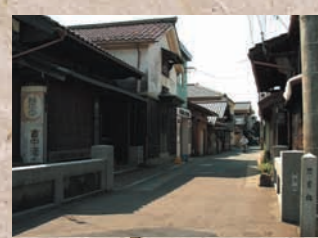
出村遊郭と思案橋 北前船の寄港地として栄えた三國には全国で5本の指に入る遊郭があったと言われていいます。その遊郭は「出村」と呼ばれ今もその名残が町並に残されています。思案橋はその遊郭の出入り口であったと言われ、行く人が「行こうか、やめようか」思案した場所です。