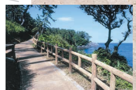
荒磯遊歩道 全長約4キロの荒磯遊歩道は、三國にゆかりの文人、詩人、俳人たちの碑が楽しめる通りです。遊歩道入口から100メートルも行くと、まず高見順の文学碑。東尋坊には、萩原朔太郎の妹アイと約5年を三國で暮らした三好達治の詩碑。その近くに、高浜虚子、虚子にほのかな想いを寄せた森田愛子、そして伊藤柏翠の句碑が並んでおり、その他に山口誓子の句碑、則武三雄の詩碑があります。